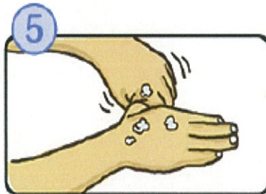
親指と手のひらをねじり洗いします。