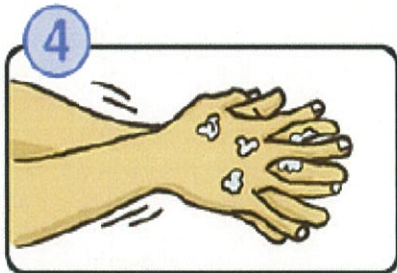
指の間を洗います。