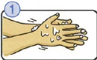
流水でよく手をぬらした後、石けんをつけ、手のひらをよくこすります。

石けんで洗い終わったら、十分に水で流し、清潔なタオルやペーパータオルでよくふき取って乾かしましょう。