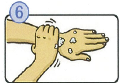
手首も忘れずに洗います。